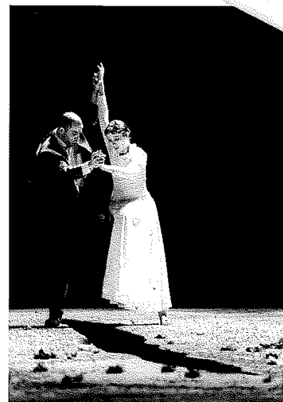
"L'Ombre du ciel"