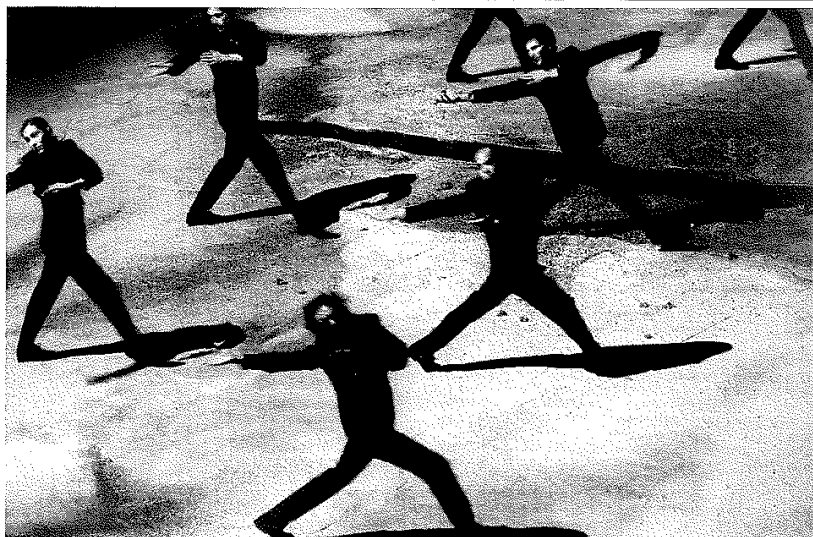
"L'Ombre du ciel"